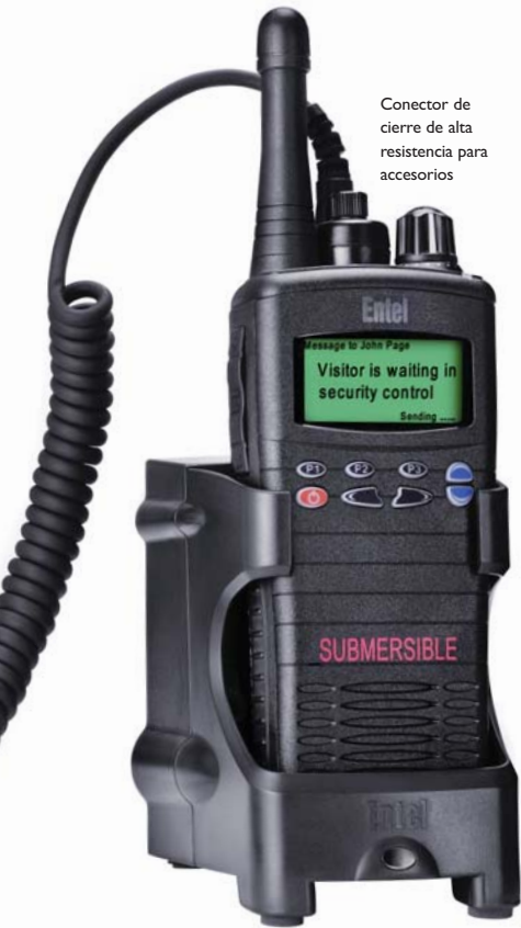
Conector de cierre de alta resistencia para accesorios