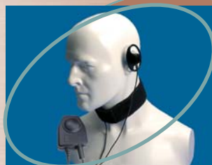
■ CXR16/750 ▲ CXR16/950