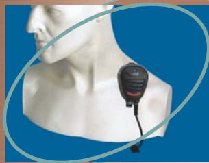
■ CMP750 ▲ CMP950