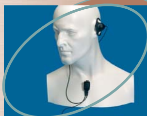
■ EA12/750 ▲ EA12/950