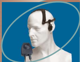
■ CXR5/750 ▲ CXR5/950