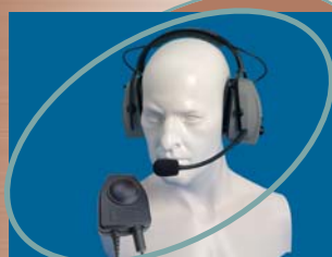
■ CHP750D ▲ CHP950D