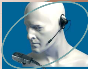
■ EA19/750 ▲ EA19/950